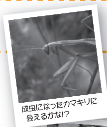
成虫になつたカマキリに 会えるかな?