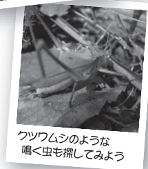
クツワムシのような 鳴く虫も探してみよう