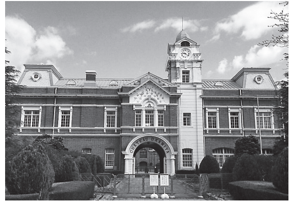
シャトーカミヤ旧醸造場施設事務室(南面)

「国指定重要文化財シャトーカミヤ旧醸造場施設」は、昨年3月11日の東日本大震災により大きな被害を受けました。「事務室」(現本館)・「醗酵室」(現神谷傳兵衛記念館)および「貯蔵庫」(現レストランキャノン)の各建物は、れんが壁体に亀裂が入るなど著しい被害に見舞われ、閉館を余儀なくされています。