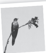
みんなで 探してみよう ホトギス