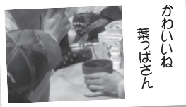
かわいね 葉っぱさん