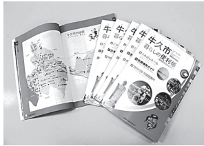
平成21年7月に発行された初版の便利帳

市役所で の手続きやご みの出し方な ど、暮らしに 役立つ情報満 載の「牛久市 暮らしの便利 帳」の第2版発行が決定しました。