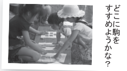
「ここに駒を すまようかな?」

ルールを覚えて、 みんなで練習してみましょう! 上手になれるアドバイスや 森の動物ミニ解説も行います。