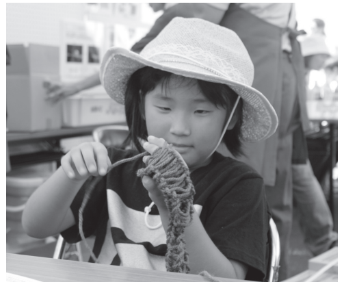
毛糸で手作りのたわしを作ったよ

題を取り上げた上映会が行われ、サブアリーナなどでは、マイバッグにお絵描きをしたり、廃材を使ってMYはしを作るコーナーや「UC(ユナイテッドドルドレン)」という、地元高校生たちが人力で電気をおこす工作教室など、楽しみながら環境を考える取り組みが行われました。