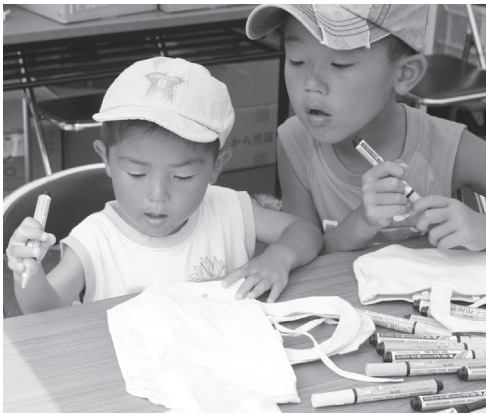
バッグに思い思いの絵を描く子どもたち