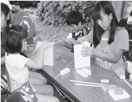
「木のおもちゃ」を作る参加者たち

そのほかにも、地元で獲れた野菜の販売やふかしたサツマイモの無料配布、夜からは盆踊りも行われるなど、お腹も思い出もいっぱいの夏祭りとなりました。