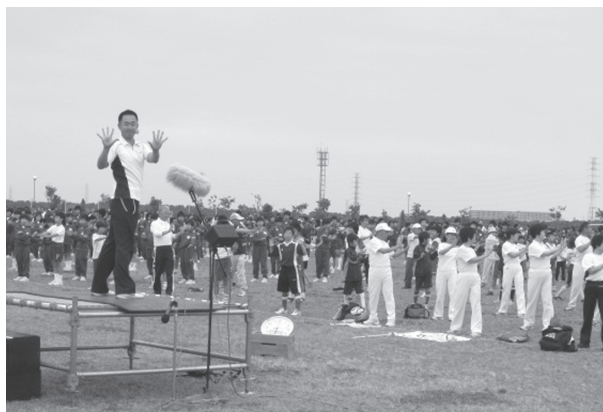
6月13日(日)、埼玉県三郷会場で行われたラジオ体操の様子