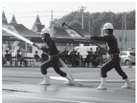
見事な動きを見せた大中分団

10月18日、守谷市の貯瓶場跡地の会場で「第60回茨城県消防ポンプ操法競技大会」が開催されました。