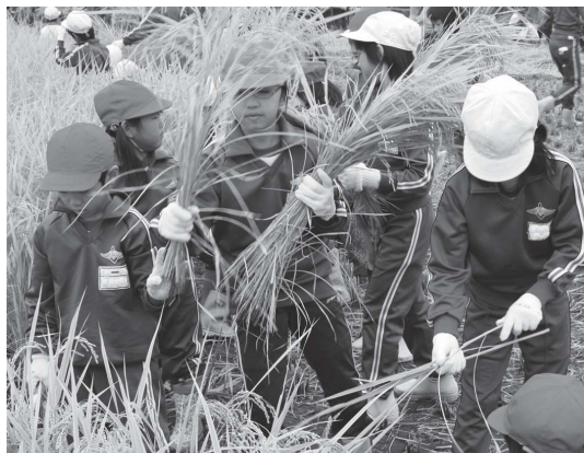
慣れない稲刈り作業に児童も大苦戦

10月1日、中根小学校で恒例 の「稲刈り集会」が行われました。 1・3・5年生の約500人の児童 とスクールボランティア、保護者 などが長靴と軍手姿で、学校わき の田んぼに集まり作業を行いました。