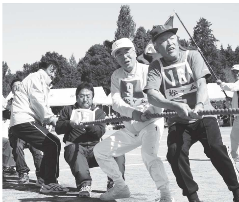
熱戦が続いた「綱引き」(岡田地区)

秋晴れの中、牛久運動公園で行 われた岡田地区の体育祭では、32 行政区が参加して、「行政区親善リ レー」や「紅白玉入れ」など多くの 種目が行われ、参加者は気持ちの 良い汗を流しました。