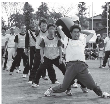
息を合わせて「順送球」(牛久地区)

行政区対抗の「綱引き」では、男 女各10人がチームとなり、力比べ を楽しみました。「よいしょ、よい しょ」と声を掛け合いながら、綱 を引く顔は真剣そのもの。息の 合った動きで会場を沸かせまし た。隣近所の住民同士親ほくを深 めるとともに、健康増進にも一役 買う体育祭となりました。