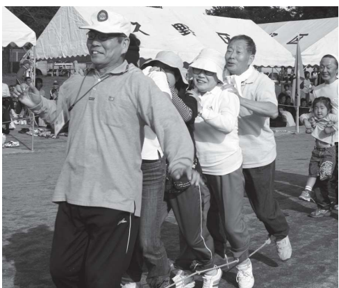
5人1組の「むかで競争」(奥野地区)