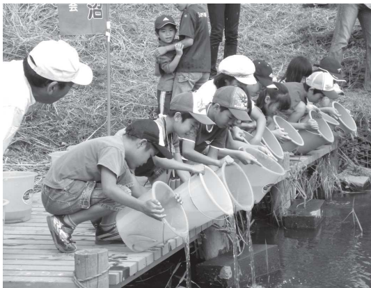
うなぎの稚魚を放流する子どもたち

うなぎの放流に参加した市内の 小学生26組72人の親子は、「大き くなって戻ってきてね!」と、うな ぎの稚魚に声を掛けながら根古屋 川に放流しました。その後、牛久 市観光アヤマ園までの道のりを自 然散策し、牛久城などの史跡を訪 ねました。