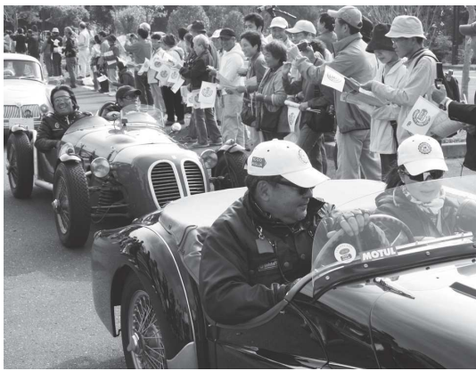
懐かしの名車が次々と大集合

10月13日、久野町の牛久大仏に国内最大の国際クラシックカーレース「ラ・フェスタ・ミッドウインター2009」がやって来ました。会場には、クラシックカーファンや近隣の住民など約200人が詰め掛けました。著名人も多数参加したこのレース。1920年代の車など約100台のクラシックカーが牛久大仏の前を通過すると観客からは「こんなに変わった車は初めて見た」と驚きの声が上がりました。