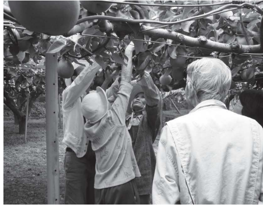
大きな梨をもぐオーナーの皆さん

今年初めて一般募集され、自分の手で収穫できる「梨のオーナー制度」の収穫が無事に終わりました。