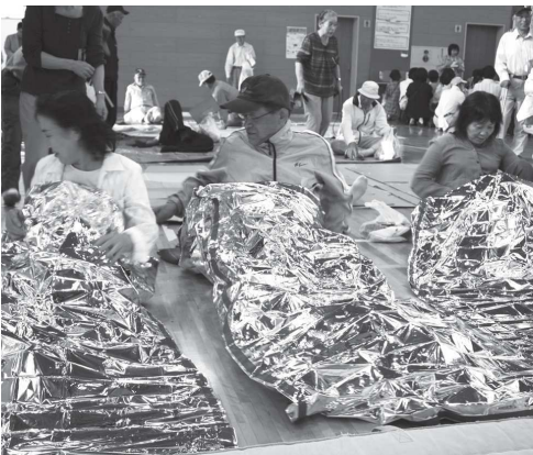
簡易寝袋の中に入る参加者たち

避難所環境体験では、体育館の床に簡易寝袋やブルーシートなどを敷き、その上に寝転びました。体験者は「こっちの方が寝やすい」などと感触を確かめていました。