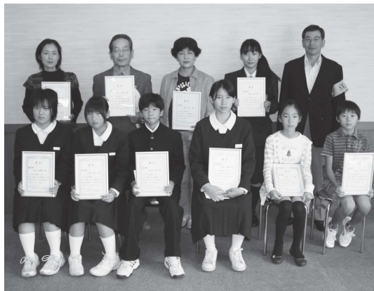
コンテストの受賞関係者の皆さん

また、「心と体を若くする運動法」をテーマにした講演会や健康度チェックコーナーなどにも多くの参加者が詰め掛け、健康維持の大切さを再確認しました。