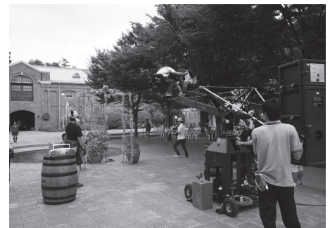
連続テレビドラマや映画の撮影で注目を集めたシャトーカミヤでの撮影