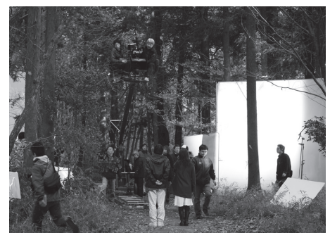
牛久自然観察の森での撮影

問い合わせ 牛久フィルムコミッション事務局(牛久市観光協会内) ☎ 874-5554