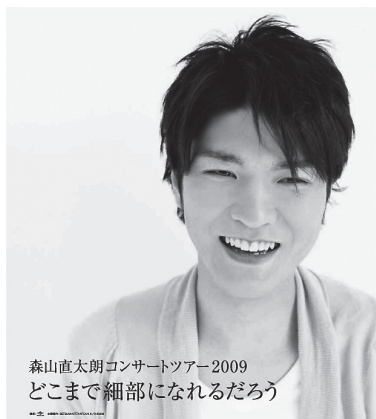
森山直太郎コンサートツアー2009 どこまで細部になれるだろう