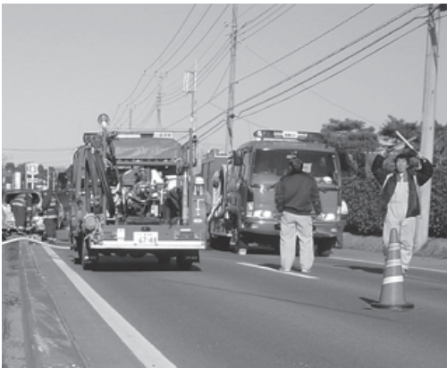
交通整理を行う消防団員

【災害に備えて】 消火栓や防火水槽の点検や周辺の草刈り、消防車や資機材の点検、夜警などを行っています。