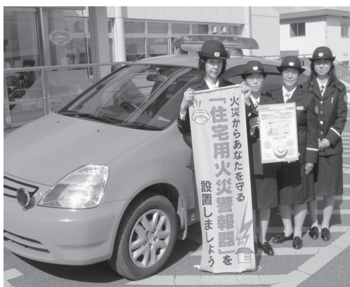
住宅用火災警報器設置促進の広報