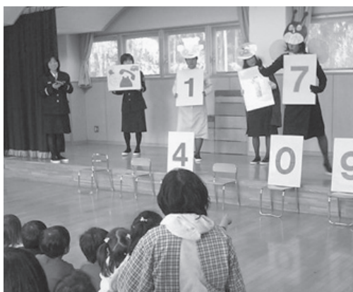
女性消防団員による防火教室

女性消防団員は火災予防を目指して、年3回の駅前キャンペーン、幼稚園・保育園での防火教室、老人クラブでの防火啓発活動などを行っています。