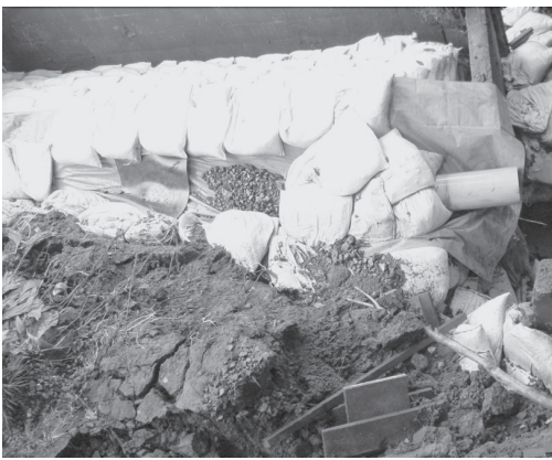
豪雨による土砂崩れ個所の土のう積み

8月の集中豪雨では、地域の状況を把握するため雨の中を巡回し、土のう積みや冠水個所の排水作業を行いました。