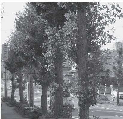
【刈谷町、南～さくら台・神谷の通り】

生長が良く長寿なので、巨木が多くみられます。古い木の枝の付け根や幹から、鍾乳石のように垂れ下がったものを乳(子)ちと言います。雄(オス)と雌(メス)の木があり、雌木にはギンナンがなります。