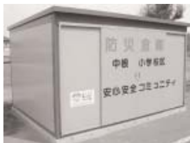
中根小学校に設置の防災倉庫 1 {

地震などによる被害防止や軽減を図るとともに、自主的な防犯活動を行うことで、安心安全な地域をつくるため、安心安全コミュニティ4団体が設立されました。