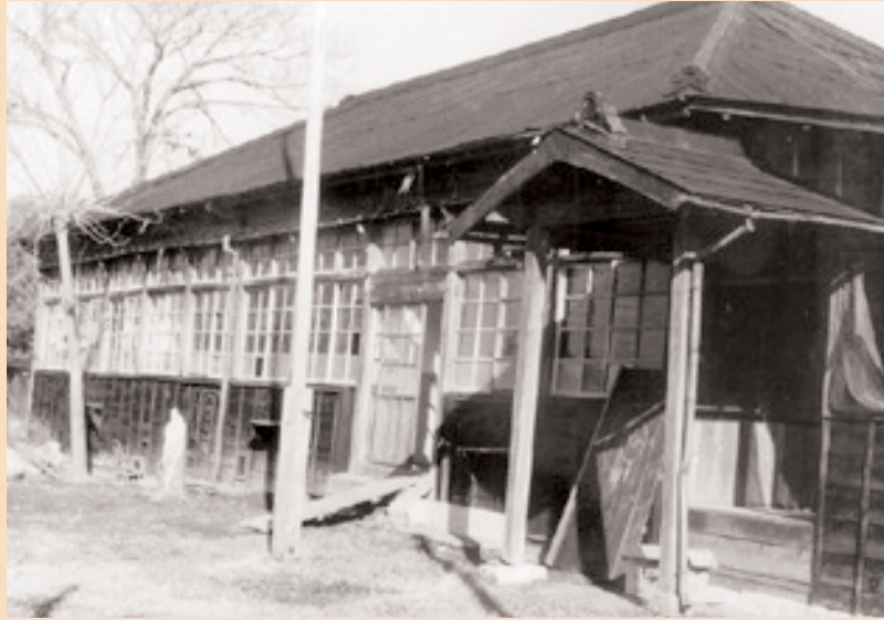
奥原分教場の写真です。現在の奥原公会堂の場所にありました。奥野第一小学校奥原分教場として、昭和40年に奥野小学校に統合されるまで、奥原地区の子どもたちが通いました。