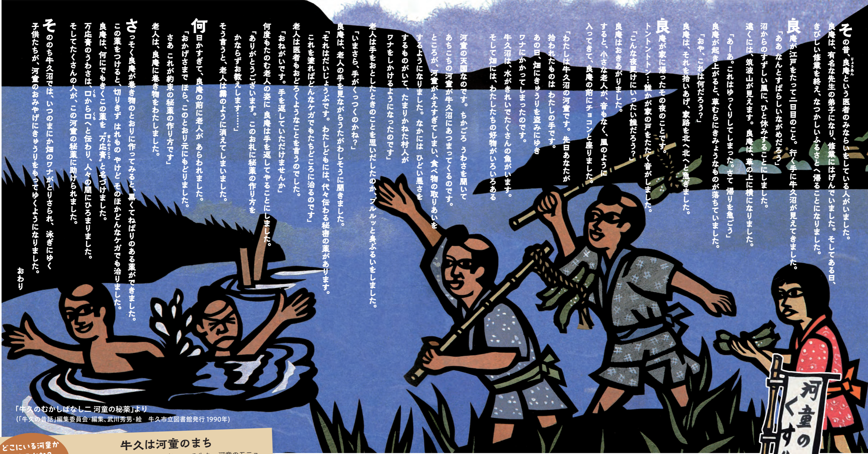
「牛久のむかしばなし 河童の秘薬」より （「牛久の昔話」編集委員会・編集、武川秀男・絵 牛久市立図書館発行 1990年）