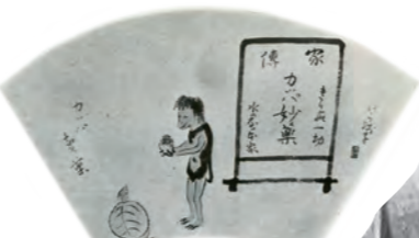
小川芋銭『河童百図』より

芋銭が書いた「河童百図」第八十九図にも河童と妙薬が登場しており、芋銭の身近にも「万応膏」があったのかもしれない。