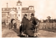
葡萄園を視察する土方久元(大正4年)