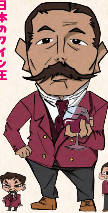
イラスト：さんげん

9歳のころ、見習い仕事の帰り道に落ちていた小判を見つけ、持ち主を探して届けたため、「松さん(幼名:松太郎)は正直者」という評判が立ったことも。