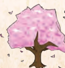
イラスト：ろくめい