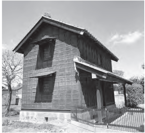
旧飯島家住宅の蔵

旧飯島家住宅の敷地は、水戸街道に接する間口が狭く、東西に細長い形をしています。これは、江戸時代、道路に接する土地の長さで税金が課せられたため、その節税対策とされています。