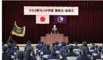
ひたち野うしく中学校開校(2020年)