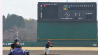
牛久運動公園野球場リニューアル(2016年)