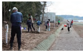
牛久沼かっぱの小径完成(2012年)