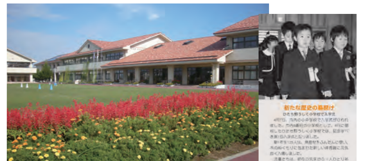
ひたち野うしく小学校開校 (広報うしく2010年5月1日号)