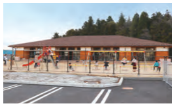
牛久第一幼稚園移転・開園(2019年)