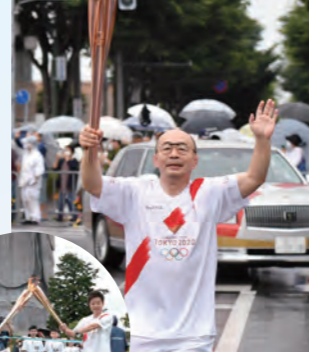
東京オリンピック 聖火リレー(2021年)