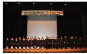
牛久市男女共同参画都市宣言(2014年)