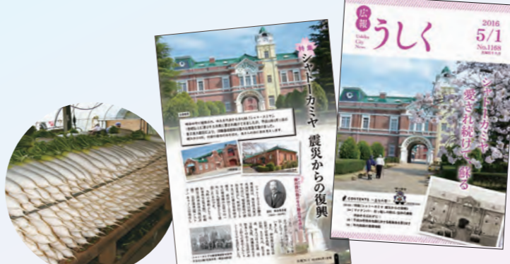
うしく河童大根が 県銘柄産地に指定(2019年)