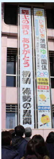
稀勢の里関 引退(2019年)