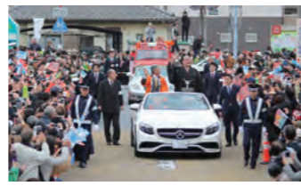
稀勢の里関 横綱昇進パレード(2017年)