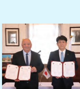
テラヴィ市 姉妹都市調印式(2026年)