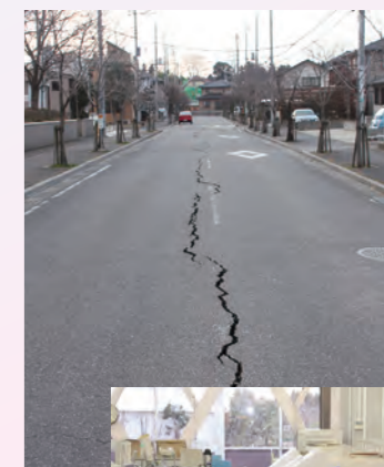
東日本大震災時の市内(2011年)