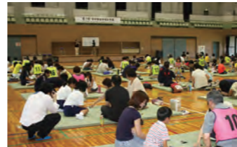
牛久郷土かるた 完成、第1回牛久 郷土かるた大会 開催(2014年)