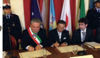
グレーヴェ・イン・キアンティ市 友好都市調印式(2013年)