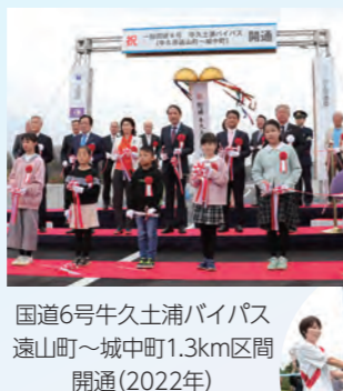
国道6号牛久土浦バイパス 遠山町～城中町1.3km区間 開通(2022年)