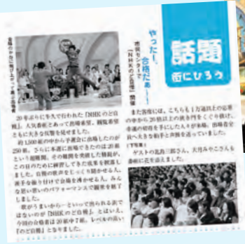
NHKのど自慢開催 (広報うしく2003年6月1日号)