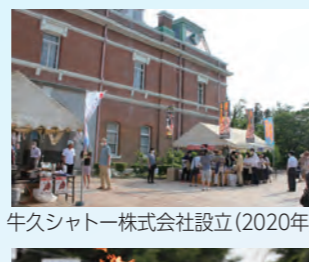
牛久シャトー株式会社設立(2020年)