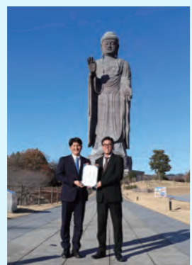
牛久大仏がうしく親善大使 就任(2024年)