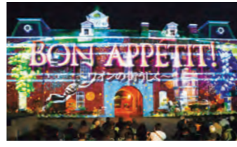
牛久シャトープロジェクトマッピング(2017年)