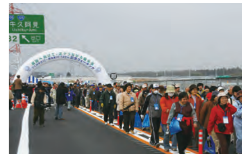
圏央道つくば牛久IC～阿見東IC間開通(2007年)