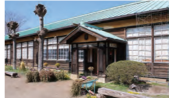
旧岡田小学校女化分校校舎が国登録 有形文化財に登録(2018年)