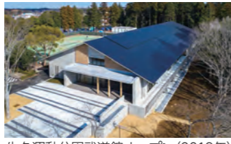
牛久運動公園武道館オープン(2019年)