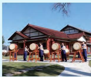
住井すゑ文学館開館(2021年)