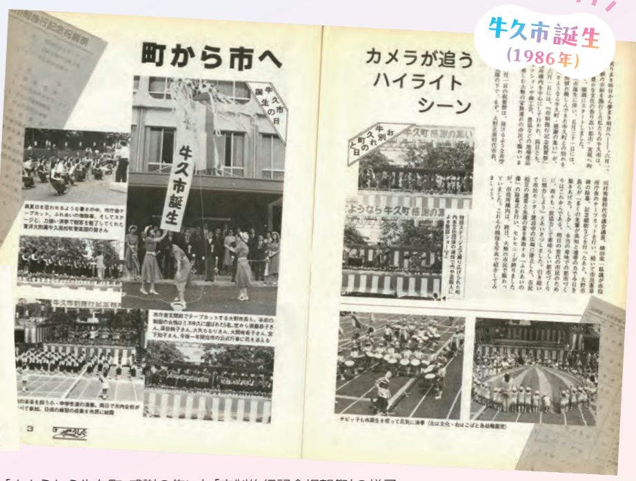
市役所敷地内で行われた「さようなら牛久町 感謝の集い」「市制施行記念祝賀祭」の様子と市制施行50周年(2036年6月1日)に開封予定のタイムカプセル (広報うしく1986年6月15日号)