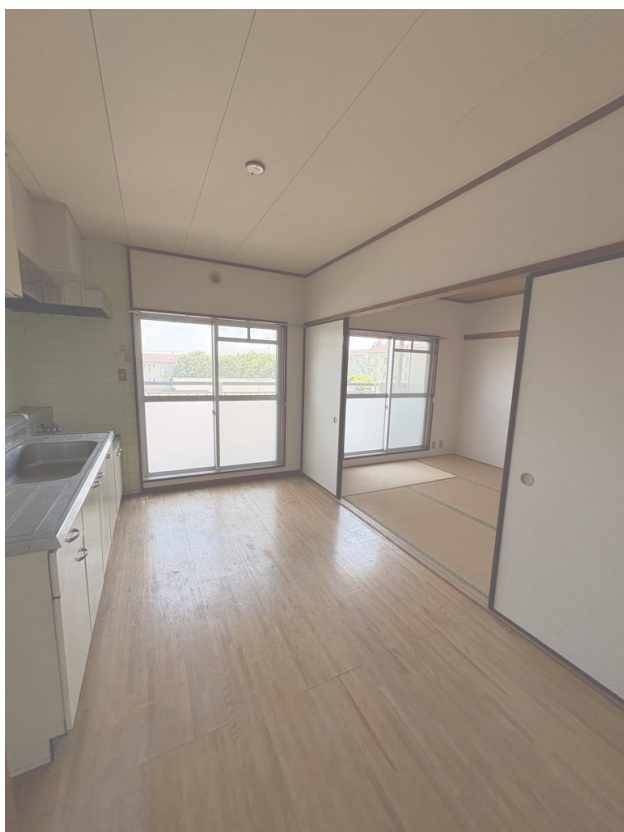
ダイニング・和室リビング