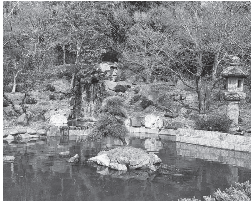
日本遺産である牛久シャトーにある清風の滝。 テレビ番組の企画で復活した。

事業者を位置づけしており、事業 所の役割として食文化が関係して くると考えている。また日本遺産 に関する取り扱いについては、基本 理念の一つとして、文化芸術に関 する施策を観光やまちづくり等の 分野における施策と有機的な連携 を図りながら推進することを掲げ ており、広義においてその中に食 文化も関係してくと考えている。