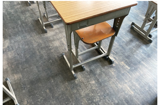
真っ黒になった床