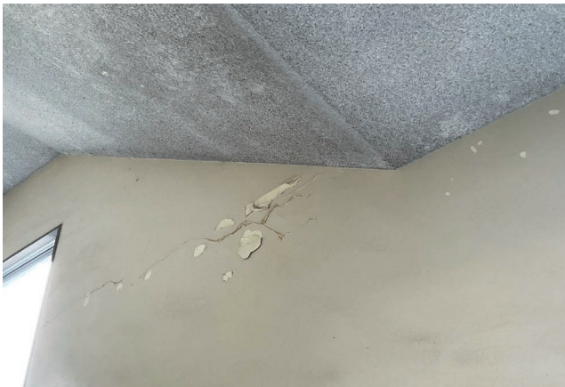
壁はひび割れて塗装がはがれている

耐用年数を80年程度延ばす。工事を行うことで、安全性の確保や現代的な教育環境の対応、省エネ化を実現できる。また、建て替えに比べ、費用や環境負荷を抑えることができる。 第一期工事として特別教室棟と技術棟の改修、第二期工事として普通教室棟や管理棟の改修を実施する。工事期間は令和8年10月から令和10年3月末まで。