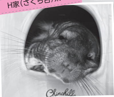
【種類】チンチラ(オス6歳)

口の横に髭のような模様があるのが特徴です。とても穏やかな性格で寝ることとおやつが大好きです!