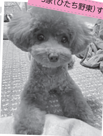
【種類】トイ・プードル(メス1歳)