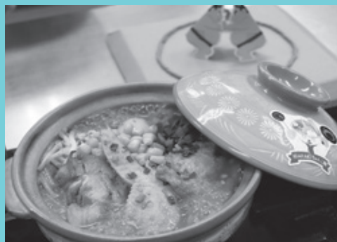
前回「シン・いばらきメシ総選挙2024」 《一般料理部門》牛久市代表 IBARAKIちゃんこ麺