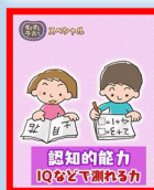
認知的能力 IQなどで測れる力