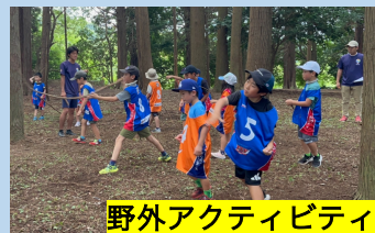
野外アクティビティ