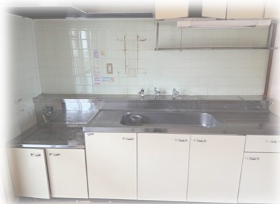
広々としたキッチン！