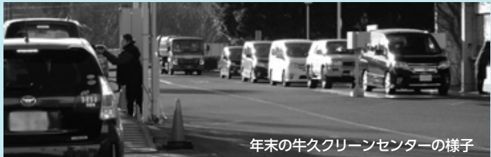
年末の牛久クリーンセンターの様子

※持ち込みでお待ちいただいている時でも、 市の委託収集車両を優先して通します のでご了承ください。