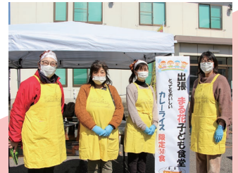
特定非営利活動法人きらきらスペース、まる花子ども食堂ではカレーを提供