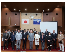
2月10日 講師を招いて牛久シャトーの利活用についての勉強会