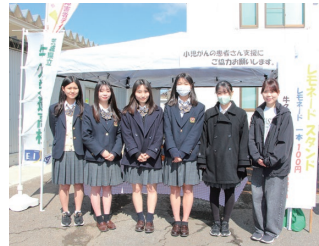
小児がんの子どもたちを支援するためのレモネードスタンド活動を行っている牛久栄進高校JRC部の皆さん