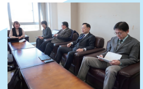
2月20日 議会運営委員会を開催し、3月議会の運営を協議