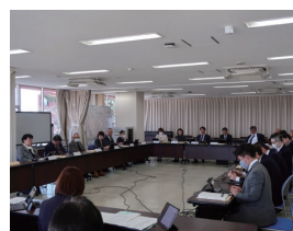
2月17日 議員連絡会にて、議会の運営に関する報告や申し合わせを実施