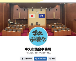
Facebookでは委員会など議会の動向を発信しています