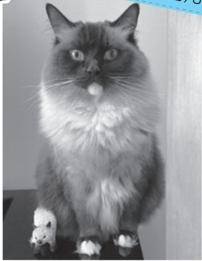
【種類】ラグドール(オス6歳)