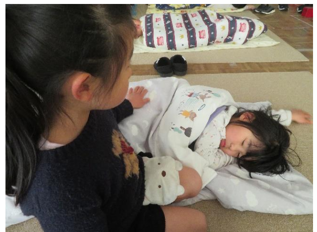
年長さんにトントンしてもらうと、気持ちが 良くて「眠くなるなあ…」