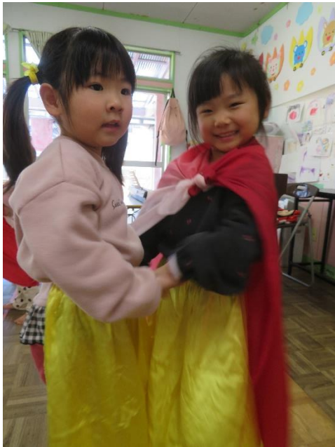
ドレスを着て、一緒に踊りましょう。