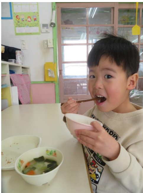
「お箸の練習頑張っているよ！」