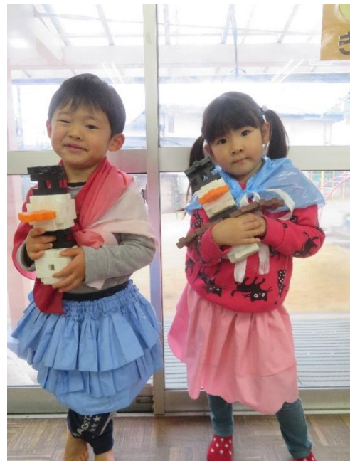
ブロックで“オラフ”を作ったよ。 「どお～！わたしもほくもかわいいでしょ。」