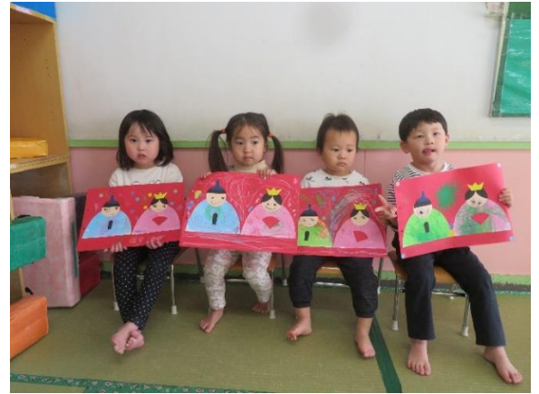
みんなの可愛いおひなさまができました。 「みんなでハイ、ポーズ！」