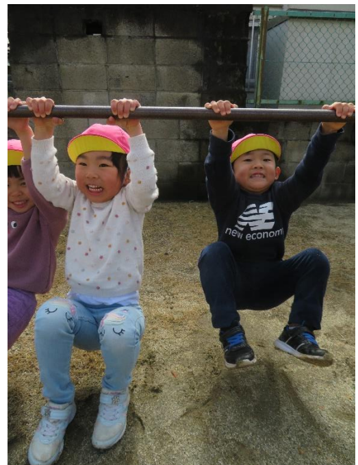
「たくさんぶらさがれるようになったよ。 すごいでしょ！」