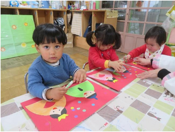
おひなさまを作りました。1歳児はシールで作って、2歳児はクレヨンを使って顔を完成させました。