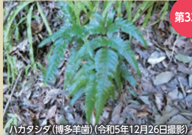
ハカタシダ(博多羊歯) (令和5年12月26日撮影)

半日陰を好み ます。茎は短 くて硬く、横 に伸びるかま たは斜めに立 ちます。葉は 長さ30〜40cm、 幅は30〜35cm です。色が濃 く光沢があり、