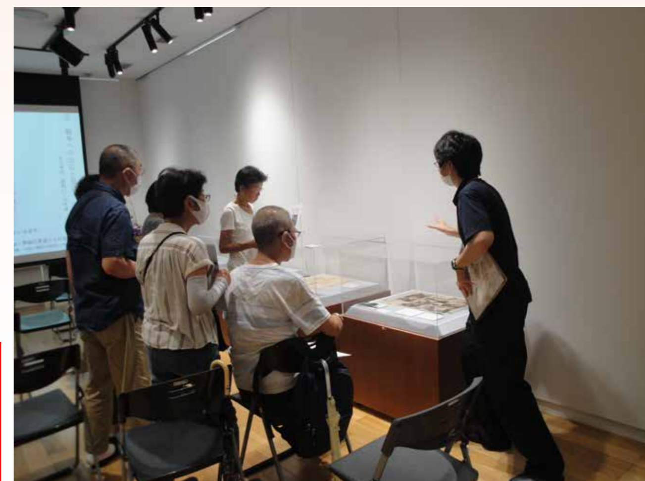
↑担当学芸員による展示解説ギャラリートークも開催します。(写真は令和5年8月開催時の様子)

会場：住井す系文学館展示棟、参加費：所定の展示棟入場料をいただきます (事前申し込み不要。当日展示棟入口にお集まりください)