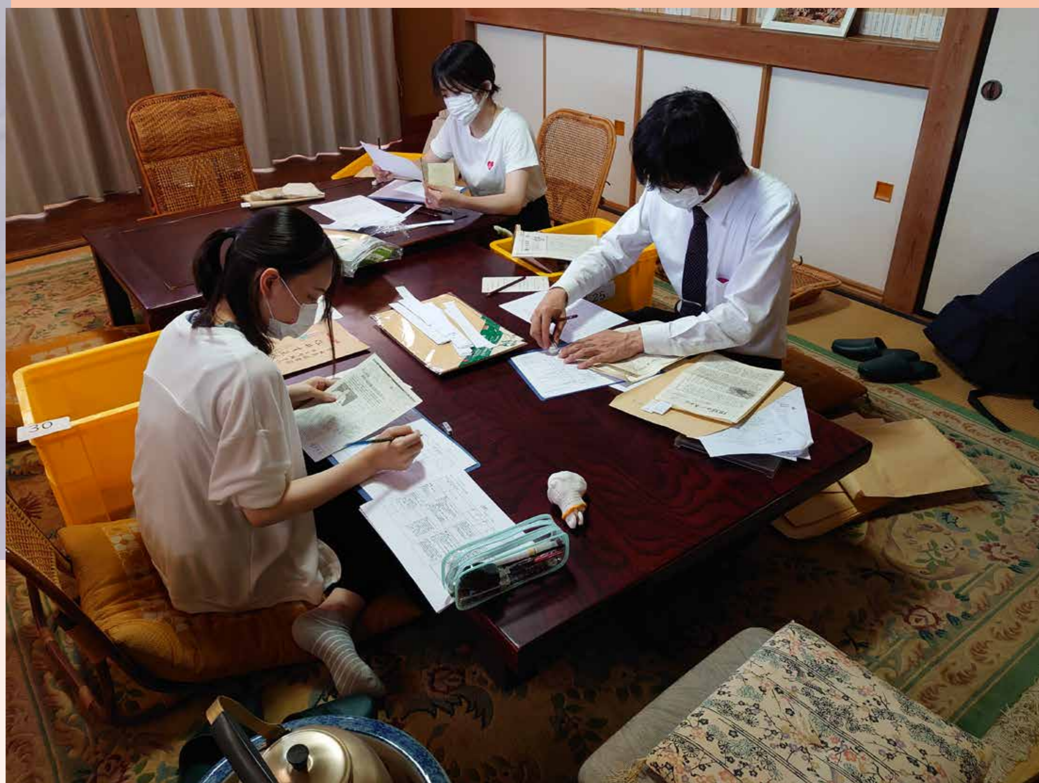
↑東海大学との共同調査の様子(令和5年9月)