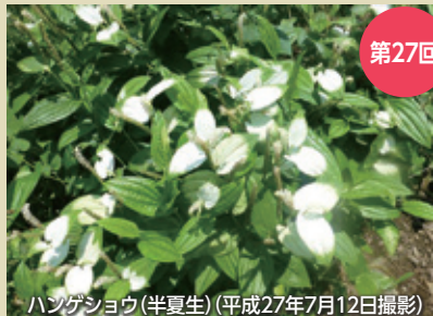
ハンゲショウ(半夏生)(平成27年7月12日撮影)

第27回 本州以西、沖縄、東アジアの水辺に分布する多年草。白くて太い地下茎を伸ばし群落を作ります。茎は60〜100cmで直立し、丈夫で縦に数本の稜があります。葉は有柄互生、10cm位の楕円形で5本の脈があり、先端が尖ります。6〜8月に茎の頂部2〜3枚の葉の表面が半分ほど白くなり、白く変化した葉のつけ根から穂状の花序を伸ばし、白い小さな