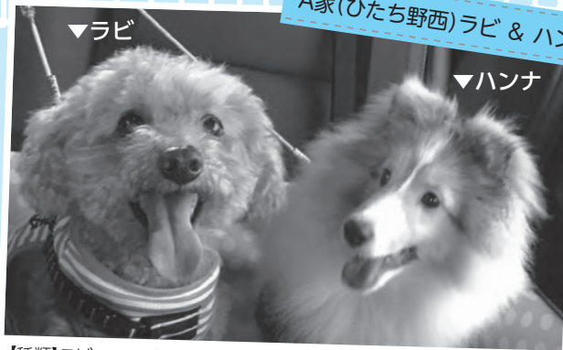
▼ラビ ▼ハンナ 【種類】ラビ…トイプードル(オス11才)、ハンナ…シェルティ(メス5か月)