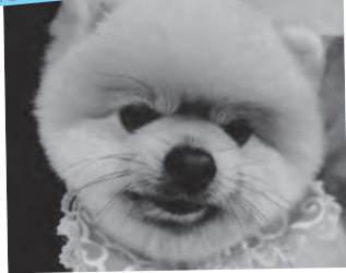
【種類】ポメラニアン(オス4才)