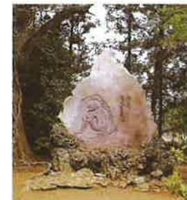
河童の碑 市指定文化財 (平成25年4月指定)