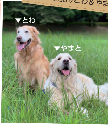
【種類】やまと…英国ゴールデンレトリバー(オス4歳)、とわ…ゴールデンレトリバー(メス11歳)