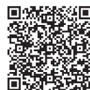
令和4年度 児童クラブ入級案内