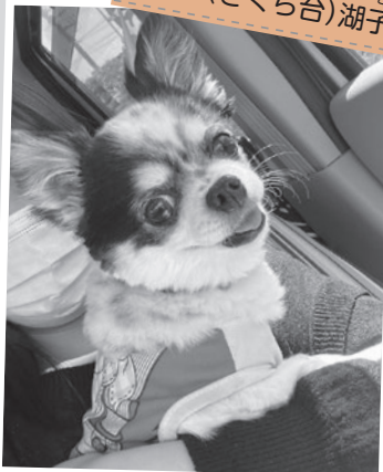
【種類】ロングコートチワワ(メス11歳)

車が苦手でしたが、旅行に行っていて以来大好きになり、いつも連れてってと乗り込んできます。