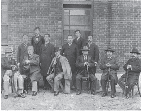
日露戦争の活躍で知られる児玉源太郎(前列右から4人目)