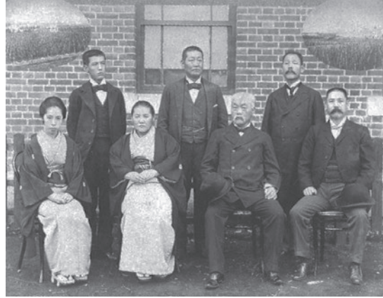
「松方財政」で知られる松方正義(前列右から2人目)

牛久醸造場(現・牛久シャトー)を訪れた元大蔵大臣・松方正義と陸軍大将・児玉源太郎の写真です。当時から本格的なワイン醸造場として注目されており、視察に訪れた政府要人たちの写真が牛久シャトーに残されています。