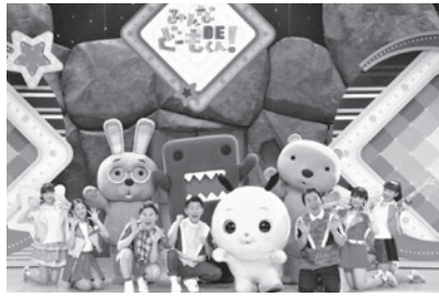
【出演】どーもくん、うさじい、たーちゃん、ななみちゃん、ジャングルポケット、まひ☆るな