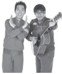
【ゲスト】テツandトモ (お笑いタレント)