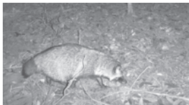
観察の森で生息しているタヌキ 冬はどんな風に過ごしているのかな?