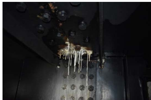
箱桁内部の遊離石灰