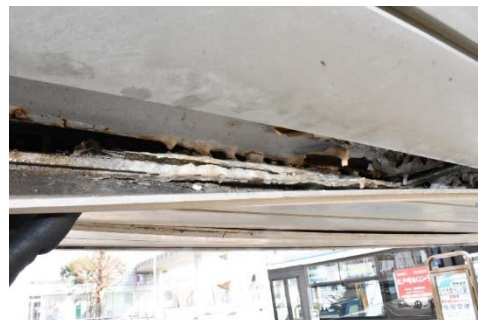
化粧板内部の腐食