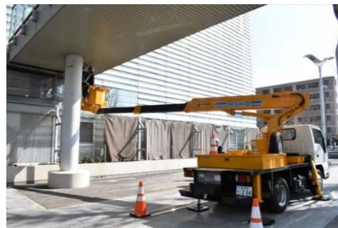
点検状況（高所作業車による）

点検の結果、化粧板内部に一部腐食が見られ、3 橋すべて予防保全の観点から措置を講じることが望ましい状態とされる「Ⅱ」判定でした。早期に措置を講じることが必要である「Ⅲ」判定や緊急に措置を講じることが必要である「Ⅳ」判定の歩道橋はありませんでした。