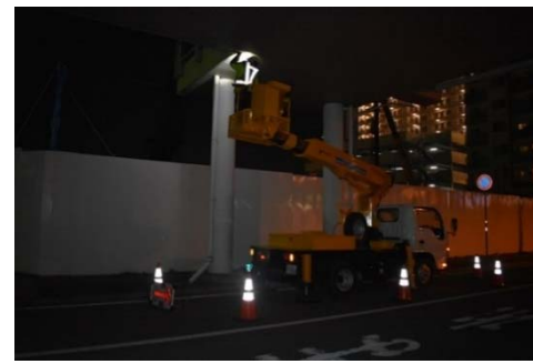
点検状況（高所作業車による）