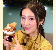
タレント ますぶちさちよ