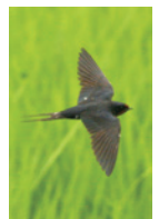
田んぼではツバメが餌を狙う姿が見られることも

雑木林や田園地帯を巡りながら約20種類の野鳥を観察します。野鳥ボランティアによる識別のサポートもあるので初めての方でも気軽にご参加いただけます。