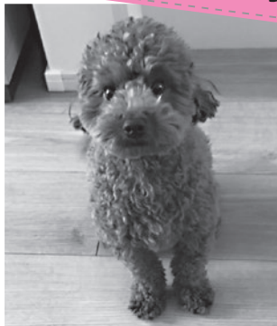
【種類】トイプードル(メス:2才)