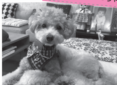
【種類】MIX(マルチーズ×プードル)(メス:2才)