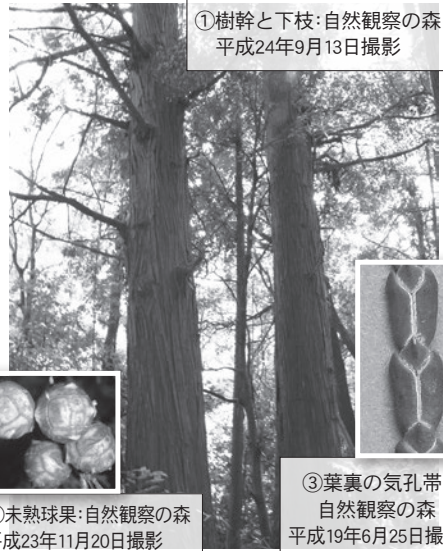
①樹幹と下枝:自然観察の森 平成24年9月13日撮影