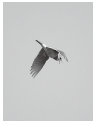
スズメ目ヒバリ科

春を告げる鳥として広く親しまれ、姿を見たことはなくとも、郊外の田園地帯で「ピーチクパーチク…」と長く複雑にさえずる声を聞いたことのある方は多いと思います。ヒバリのオスは繁殖期の春になると、空中の高いところでホバリングしながら大きな声でさえずるようになります。「ヒバリの高鳴き」として知られています。 ヒバリは茨城県のシンボルとして県の鳥に指定されています。地上にいるときは保護色でわかりづらいのですが、空中でさえずっているときは見つけやすいので、声を聞いたなら、ぜひ姿を探してみてください。