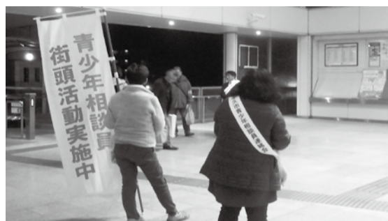
ひたち野うしく駅でのキャンペーンの様子