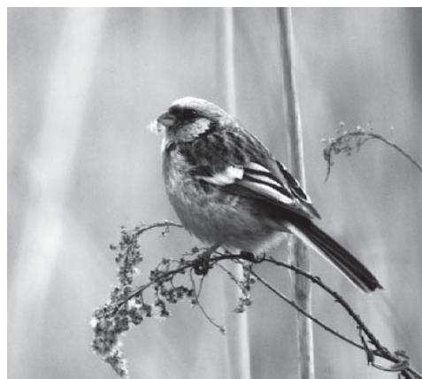
ベニマシコ スズメ目アトリ科 (紅猿子)

「フイ、フイ…」と鳴くスズメぐらいの小鳥で、オスの成鳥は体色が赤くなることから、冬になると北の国から渡ってくる赤い鳥として親しまれています。市内では低木の点在する草原やヨシ原、雑木の林縁などで見られ、越冬時は数羽ずつが小さな群れを作り、丸みを帯びた短いくちばしでススキやセイタカアワダチソウの穂、草の実などを食べています。オスの顔の赤い部分が猿の顔のように見えることから、「猿子(ましこ)」という名が付いたと言われています。