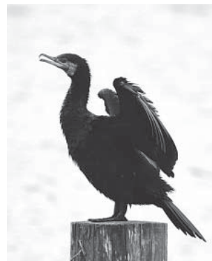
カツオドリ目ウ科

水に潜って魚を捕えて食べる水鳥で、水上に突き出た杭の上などで、翼を広げて乾かしている姿がよく見られます。水面にいるときは、首と背中しか水上に出ていないため、あまり大きく見えませんが、実際はカラスより2回りくらい大きく、体長80cmほどもあります。現在は数も多く普通に見られますが、1970年代に一時絶滅寸前になり、上野の不忍池など全国数カ所で見られない時期もありました。市内では、牛久沼と霞ヶ浦の間を移動する群れが、隊列を組んで飛ぶ様子がしばしば観察されます。