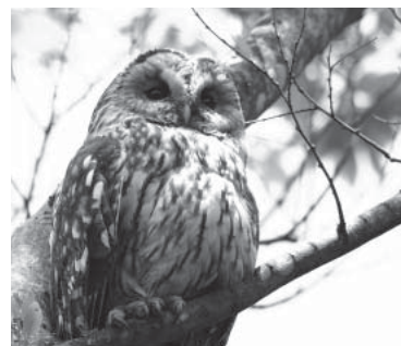
フクロウ目フクロウ科 フクロウ (梶)

新緑の里山でフクロウに出会いました。人の往来にはすっかり慣れていくように、あくびをしたり居眠りしたり、ほとんど動きません。おかげで獲物をとらえやすいよう前後に2本ずつになっている足の指などがじっくり観察できました。 牛久の郊外にはフクロウの生息に適した森や畑などが混在する里山がたくさん残っています。これからは人とフクロウがずっと共存できるまちにしていきたいものです。