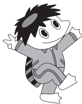
生涯かっぱつキューちゃん

お正月の食べ過ぎや運動不足が気になる年明けにウオーキング教室を企画しました! 正しい基礎知識を学んで、楽しく市内を歩いてみませんか? 生活習慣病予防や健康増進、転倒予防にも役立つウオーキングで健康な体づくりをしましょう。