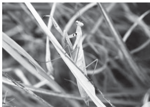
カマキリ目カマキリ科

広い草原に生息する中くらいの大きさのカマキリで、前足のつけ根の内側に黒地に白の斑紋があるのが特徴です。 牛久市内ではこれまでに5種類のカマキリが観察されていますが、その中でいちばん記録が少なく、県内でもまれなカマキリのため、今後の生息分布調査などが期待されます。