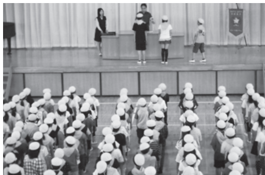
牛久小学校の入団式の様子

5月25日、牛久小学校で交通安全少年団の入団式が行われ、新たに5年生85人が交通安全団員に任命されました。市内の5・6年生の交通安全団員は積極的に交通事故防止の活動をします。毎月1・10・20日の学校登校日(休日はその翌日)に黄色のベレー帽、腕章、スカーフを身につけて交通安全を呼び掛けながら登下校しています。